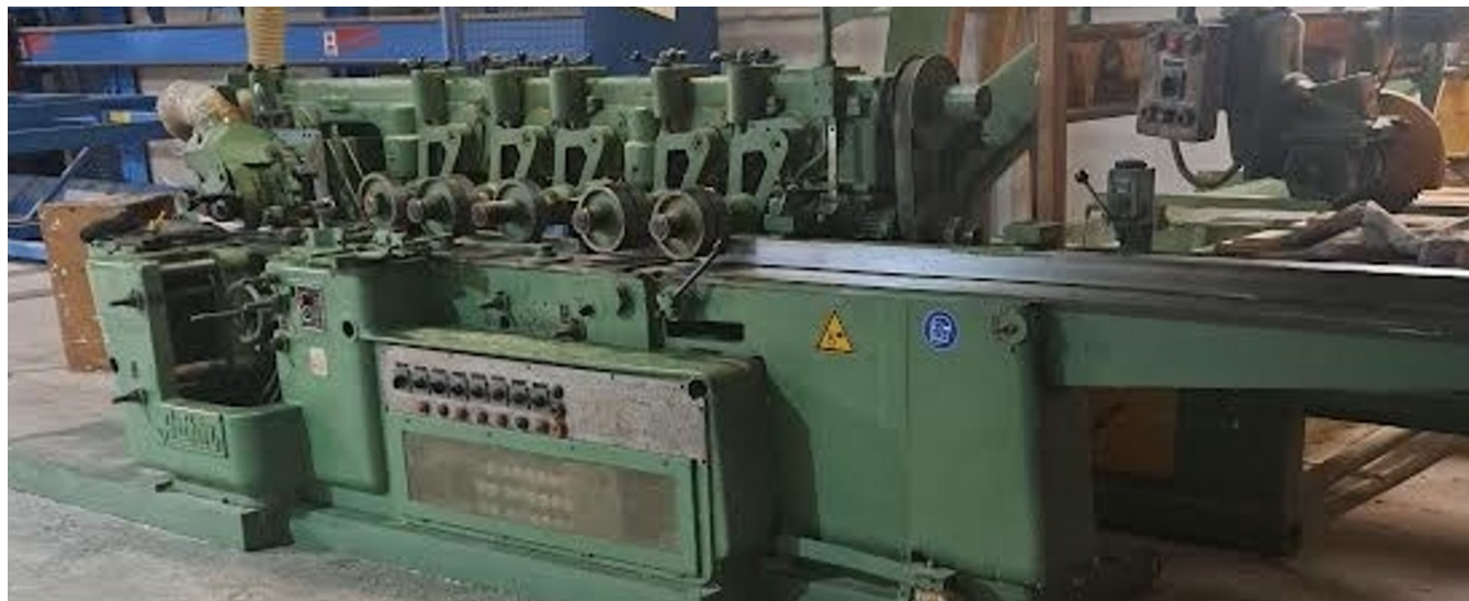
Ældre Dobbelttapper Spanevello SPA-STDE 3 motorer i hver side